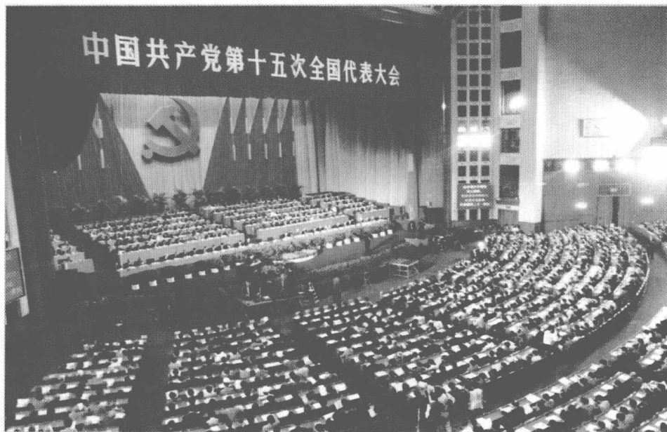
中国共产党第十五次全国代表大会会场。