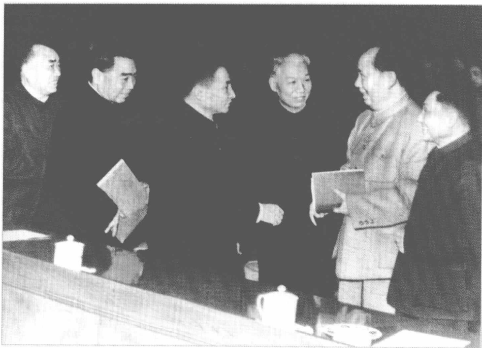
毛泽东、刘少奇、周恩来、朱德、陈云、邓小平在1962年初扩大的中央工作会议（七千人大会）上。