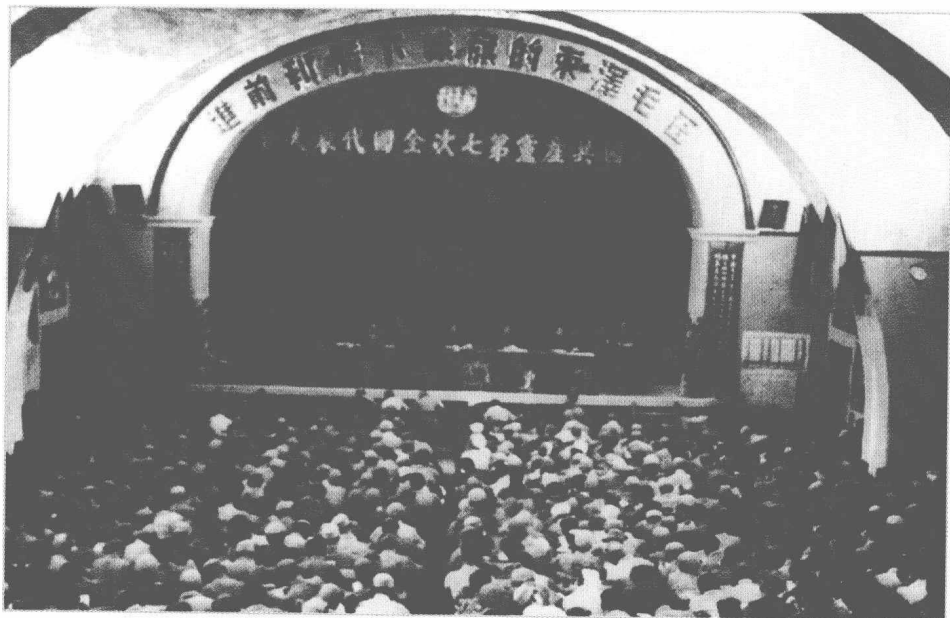
中国共产党第七次全国代表大会会场。