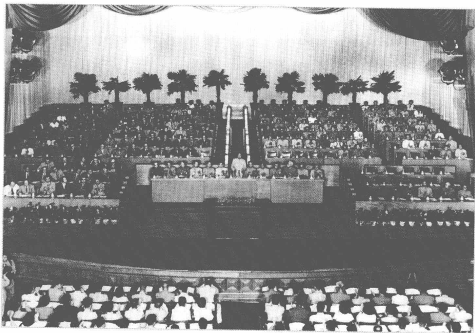
中国共产党第八次全国代表大会会场。