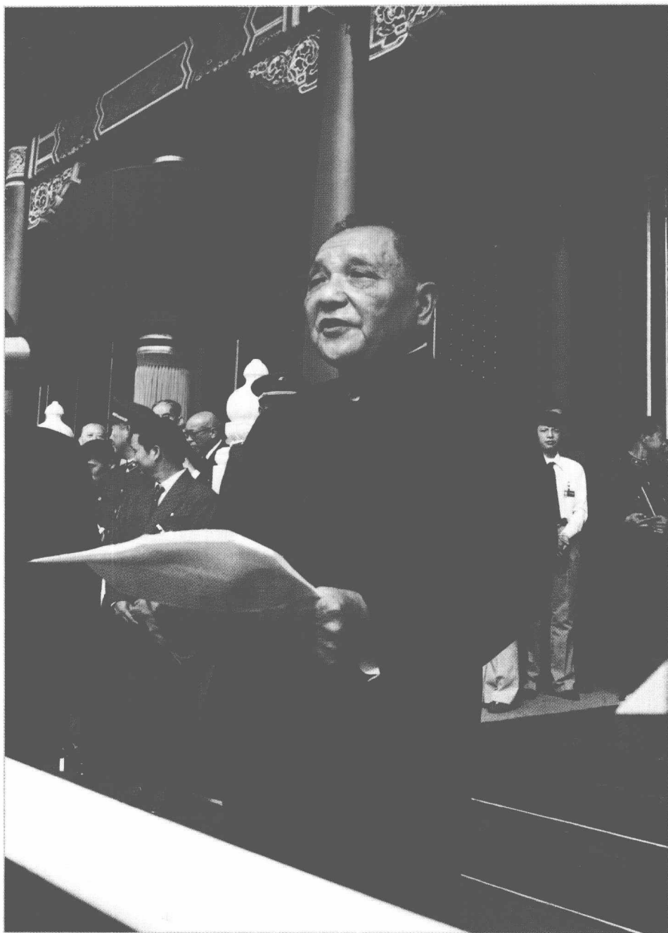
1984年10月1日，邓小平在中华人民共和国成立三十五周年庆祝典礼上发表讲话。