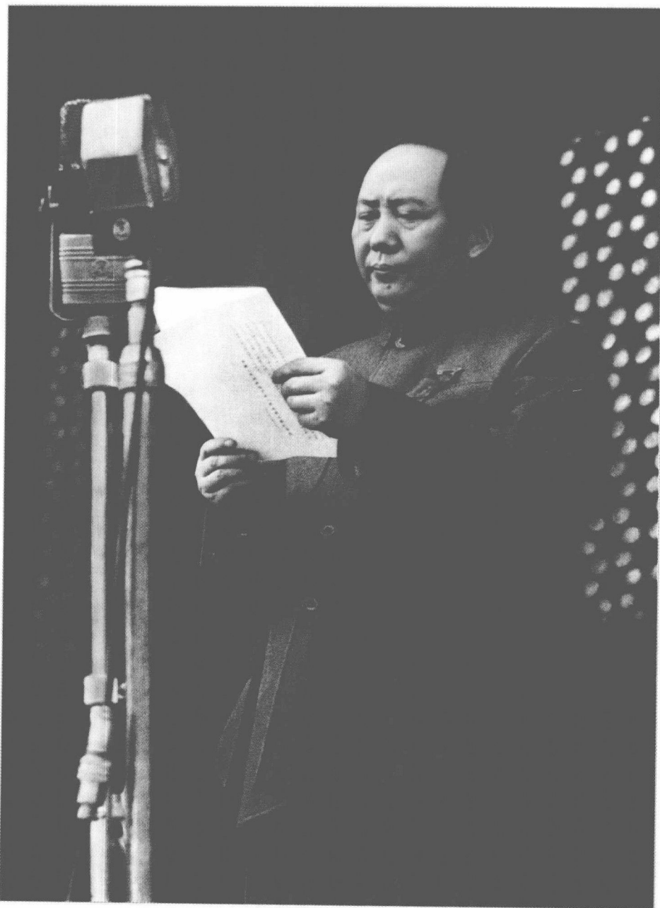
1949年10月1日，毛泽东在天安门城楼上庄严宣告中华人民共和国中央人民政府成立。