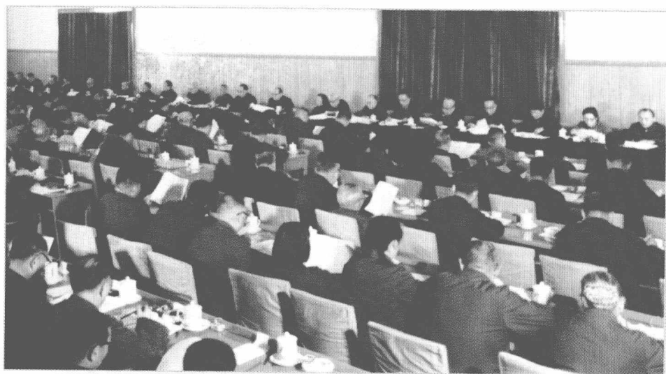
中国共产党第十一届中央委员会第三次全体会议会场。