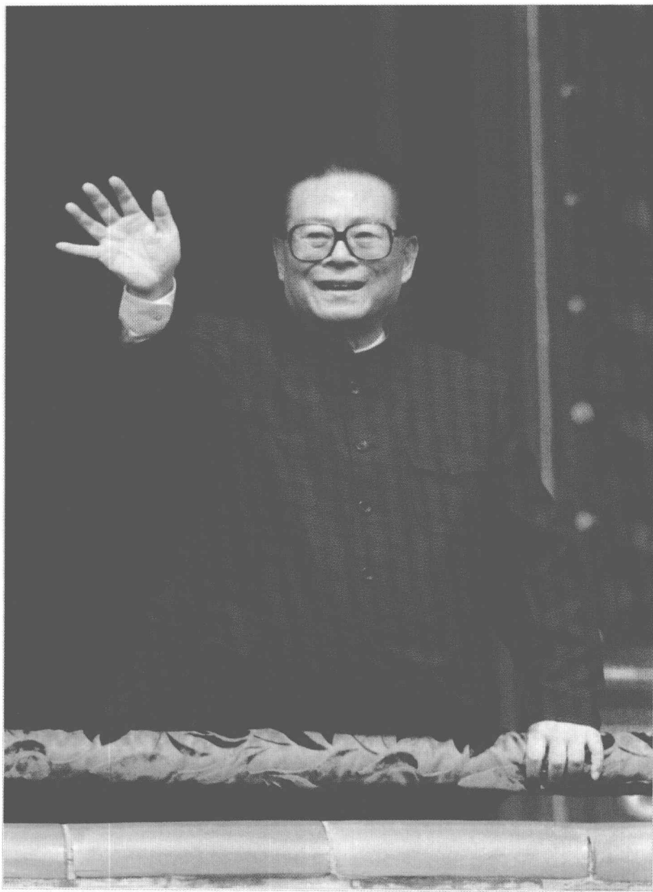
1999年10月1日，江泽民在天安门城楼上向参加庆祝中华人民共和国成立五十周年大会的群众游行队伍挥手致意。