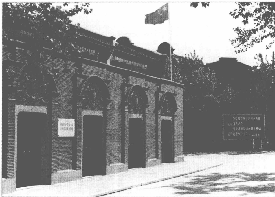
中国共产党第一次全国代表大会会址。